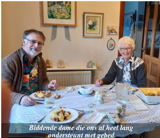
Biddende dame die ons al heel lang ondersteunt met gebed

Binnen ECM is de zorg voor haar werkers op vele manieren zichtbaar. Het begint al als je een eerste gesprek hebt met iemand van het kantoor. Met liefde en zorg worden samen met jou stappen gezet om je te oriënteren en je voor te bereiden om te werken als zendingswerker in je eigen land of ergens anders in Europa. En dan zijn er veel andere momenten en manieren om die zorg voor en met elkaar te ervaren. Bijvoorbeeld door met een teamlid een maaltijd te houden, je leven te delen, te bidden enz. De gebedskalender die verzonden wordt. Ook zijn er PDC's (personal development conversations); dit zijn gesprekken waarin je plannen maakt hoe je werk gaat en waar je hulp nodig hebt etc., trainingen, conferenties. Voor de jongeren