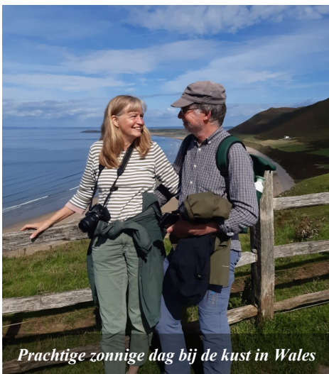
Prachtige zonnige dag bij de kust in Wales