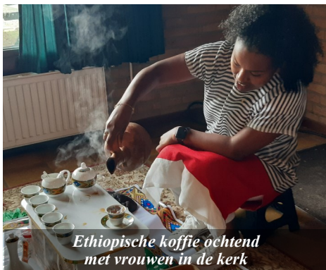
Ethiopische koffie ochtend met vrouwen in de kerk