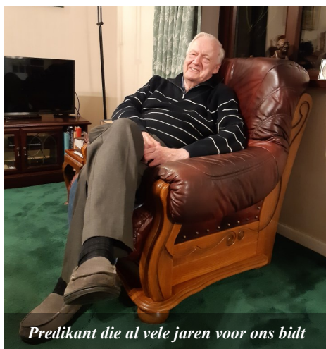
Predikant die al vele jaren voor ons bidt